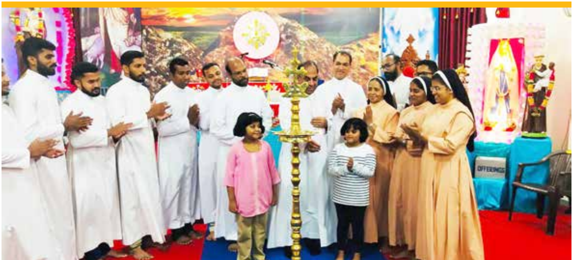
Hearty Welcome to the new Priests and Sisters in Punjab Mission