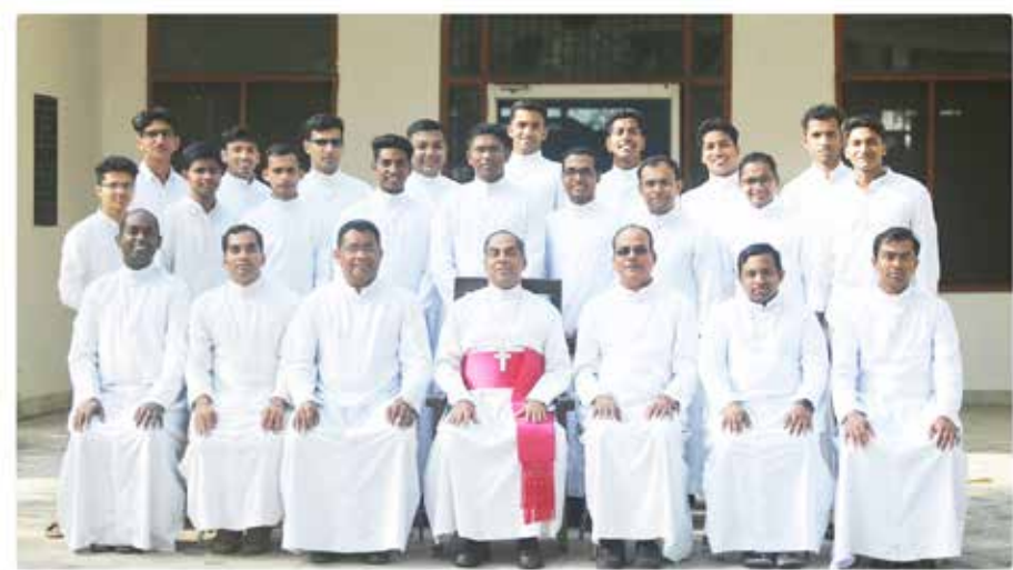
Archbishop with major seminarians of the diocese during their vacation camp at Sanjoepuram Children's Village.