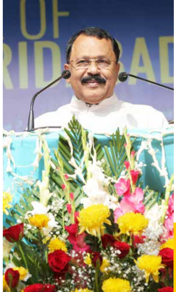
സുവർണ്ണ ശതകം 10 th Anniversary

ഭാഷയ്ക്കും, സംസ്കാരത്തിനും ക്രൈസ്തവസഭ നൽകിയിട്ടുള്ള സേവനങ്ങൾ അവിസ്മരണീയമാണ്. ഹെർമൻ ഗുണ്ടർട്ടും അർണോസ് പാതിരിയും, ചാവറായച്ചുനുമൊക്കെ നാടിന് നൽകിയ സംഭാവനകൾ മതങ്ങൾക്കെല്ലാം ഉപരിയാണ്. മുളളർ പറഞ്ഞു, എനിക്ക് തലച്ചുറ്റുന്നത് ഹിമാലയത്തിന്റെ ഉയരം കണ്ടിട്ടല്ല, വേദങ്ങളുടെ വ്യാപ്തി കണ്ടിട്ടാണ് എന്ന്. ഗോവയിലെ സെമിനാരിയിൽ വിവേകാനന്ദന്റെ ഫോട്ടോ കണ്ടപ്പോൾ റെക്ടറോട് ചോദിച്ചു, ഇതെങ്ങനെ ഇവിടെ എത്തി എന്ന്. അദ്ദേഹം