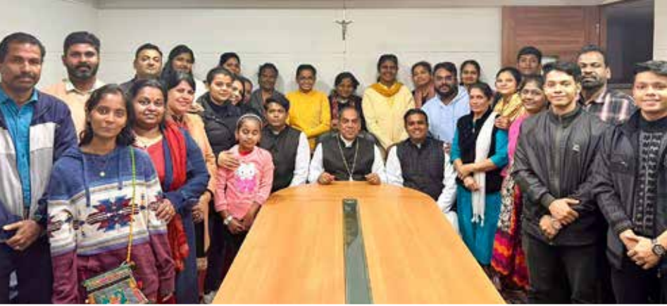
Diocesan Choir Team with Archbishop Kuriakose Bharanikulangara